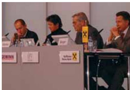
Rückblick Symposium 2005

Am 18. Oktober 2006, ab 9.00 Uhr in den Räumlichkeiten des langjährigen Sponsors RZB, sind unter dem Motto „Franchising – Seit über 20 Jahren ein GEWINN für die Wirtschaft Österreichs“ Vorträge von folgenden „Franchise-Hochkarättern“ für Sie geplant: Treppenmeister, McDonald's, abc markets, Palmers, mobilkom, Syncon Consulting sowie eine anregende Podiumsdiskussion. Rasch anmelden, die Teilnehmerzahl ist beschränkt. Information & Anmeldung: Barbara Wallner, GEWINN, E-Mail: b.wallner@gewinn.com